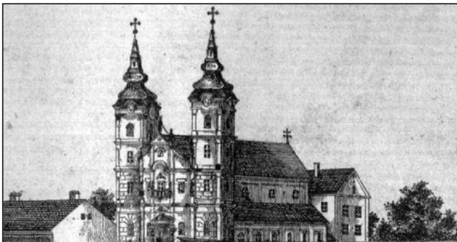
A Csáky püpek támogatásával felépített debreceni Szent Anna templom

A megszerzett kedvező pozíció birtokában azonban már más hangnemben beszélt a debreceni polgárokkal. A városi levéltár őrzi azt a levelet, amely ennek a megváltozott szemléletnek ékes bizonyítéka. Az 1719 júniusában Kalocsáról írott sorok egyrészt utalnak az akkorra már kialakult jó viszonyra, amikor a következőképpen fogalmaz: „Miképp gyönyörközem eleitől fogvást benne, hogy kegyelmekkel a jó Harmóniát és szomszédságot megtartcsam.” Ugyanakkor benne rejlik a konfliktusok újraéledésének esélye is: „Remélem ezután sem fogh adni Kegyelmetek valami izetlenségre okot, amelyre kérem is, intem is Kegyelmeteket.” Az utóiratban viszont mutatja a város törekvései további támogatásának lehetőségét is: „valamit az én tehetséggemmel felér Kegyelmetek, kézségemben fogyatkozást nem fog tapasztalni.” 32 1719. július 29-én, a Lőcséről írott levelében reagált a város nagy tragédiájára, hallotta – írta meg a város tanácsának – „Kegyelmeteknek az irtóztató tűz által lett nagy kárvallását”. Savoyai Jenő herceg két levele alapján Csáky akkor azt is tudta, hogy a nádor augusztus 2-án tájékoztatja a státusokat, s őt bízzák majd meg az 1702. évi állapothoz hasonlóan egy rectificatio elkészítésével, de „kés vagyok Kegyelmeteknek mindennemű pártját fogni”. 33